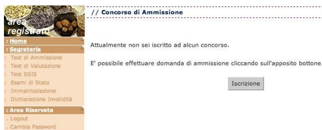
Fig. 7 – Pagina per l'accesso alle preiscrizioni

Una volta ottenuto l'accesso all'area riservata, seleziona il link “Test di ammissione” posto nella sezione “Segreteria” del menu a sinistra.