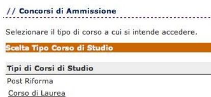
Fig. 8 – Finestra per la scelta del concorso

Nella pagina successiva devi scegliere la tipologia di concorso legato al corso di studio a cui vuoi iscriverti (Fig. 8).