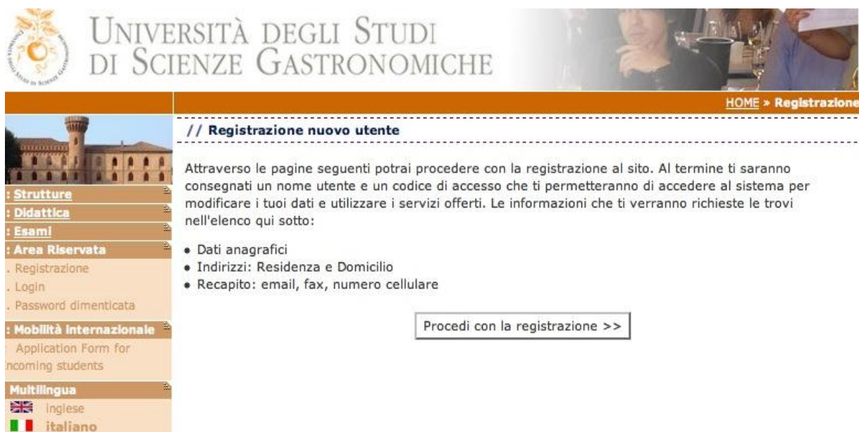
Fig. 3 – Finestra iniziale per la registrazione di un nuovo utente

Cliccando sul pulsante “Procedi con la registrazione” ti sarà proposta una serie di finestre per l'inserimento dei tuoi dati personali: anagrafica, domicilio-residenza, recapiti telefonici ed e-mail (Fig. 4, 5, 6).